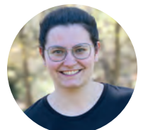
Damaris Blessing kids-team Westerwald

Dieser Junge ist so einzigartig und auf ausgezeichnete Weise von Gott geschaffen (Ps 139,14). Gott, der Schöpfer jedes einzelnen Menschen, hat gerade auch diese besonderen Kinder im Blick und liebt sie.